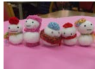
キルト芯で作る雪だるま