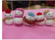
キルト芯で作る雪だるま